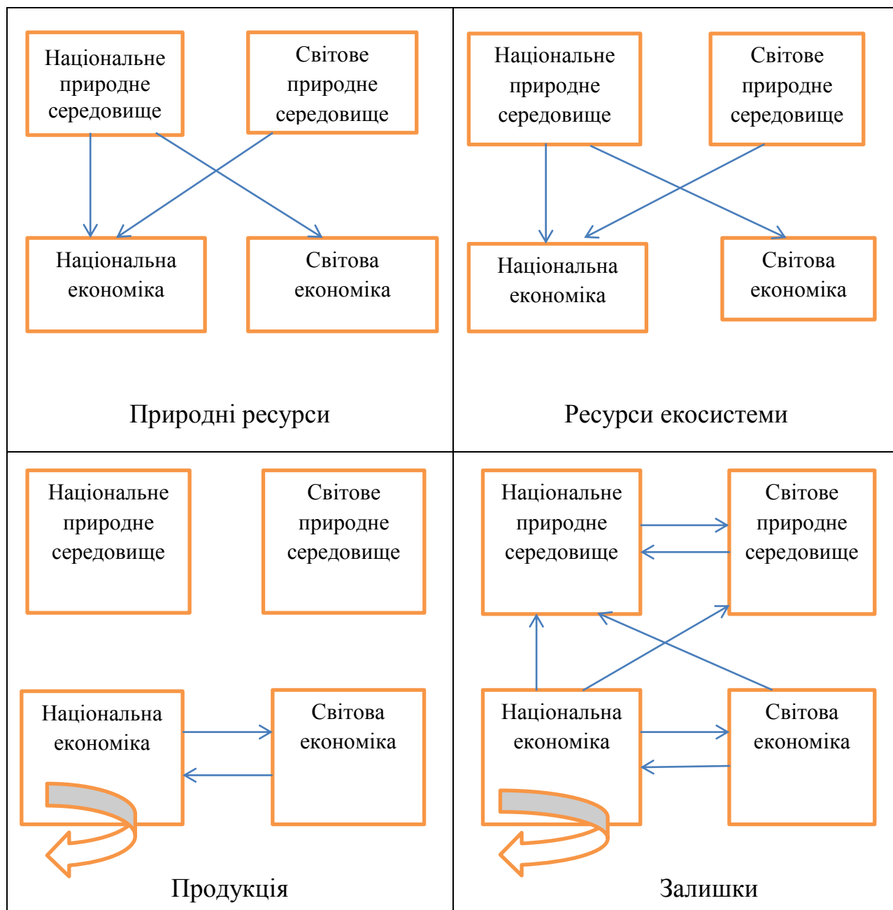
Рис.1. Походження, переміщення та взаємозв'язок фізичних потоків